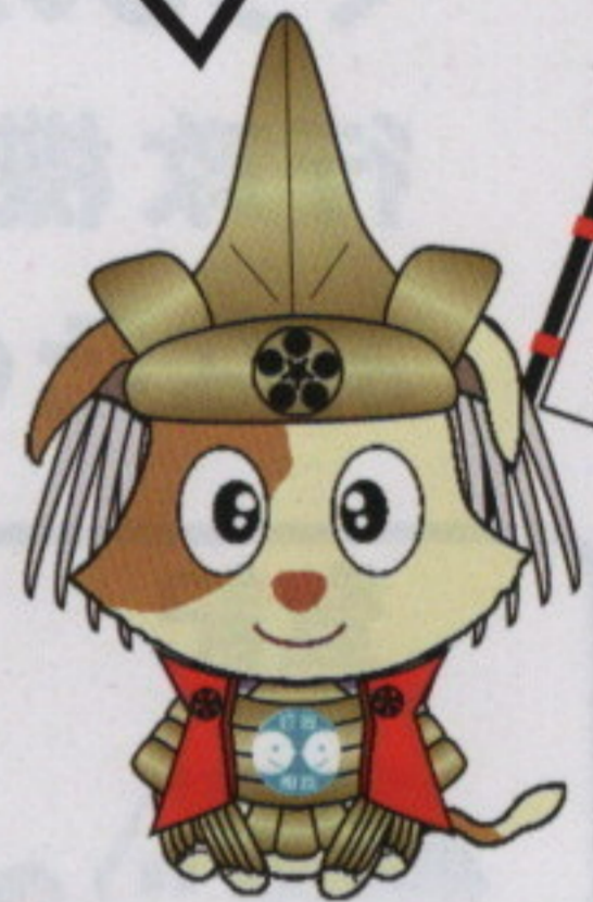
行政相談マスコット キクーン